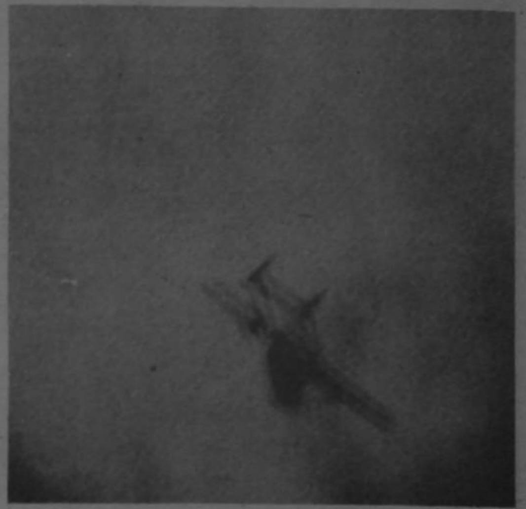
AVIONES NICARAGUENSES picaron sobre el grupo costarricense para ametrallarlo y lanzarle cohetes, como se ve en la fotografía.

Los periodistas, quienes se encontraban estacionados en Los Chiles desde anteayer cuando se supo del ataque guerrillero