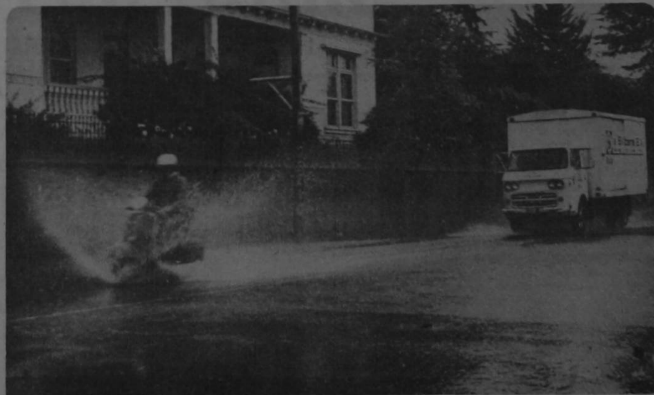
Aunque las alcantarillas rebalsadas de la ciudad de San José constituyen únicamente una incomodidad y hasta cierto punto un peligro, la situación en los barrios del sur de San José sigue siendo acongojante cuando llueve fuerte, ante el peligro de que las casas se inunden y tengan que abandonarlas. Ayer fue uno de esos días. Es un problema que desde hace algún tiempo se viene tratando de solucionar y que se originó hace medio siglo, cuando construyeron el alcantarillado. (M. Castillo)

En el lugar del accidente quedaron muchos rastros que podrían orientar a las autoridades hacia la identificación del autor y que servirán posteriormente para presentar la denuncia en su contra en los tribunales de justicia.