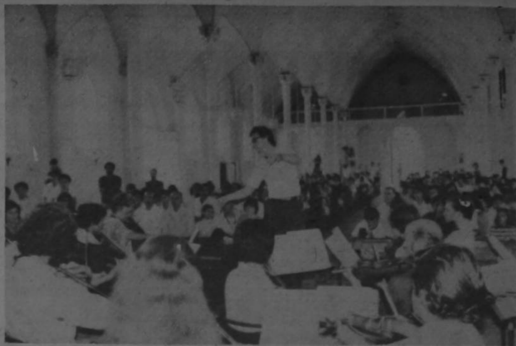
Teniendo como marco la iglesia, la Orquesta Sinfónica Nacional ejecutó el domingo pasado un concierto en la ciudad de Atenas. La actividad forma parte del concurso Cultura en Marcha que periódicamente visita los diferentes pueblos del país con el objeto de llevar diversos espectáculos culturales.

Tanto los miembros de aquella alejada localidad, como los provenientes de algunos sitios aledaños y de la ciudad capital, participaron activamente de una nueva edición de este programa que impulsa activamente el Ministerio de Cultura, Juventud y Deportes.