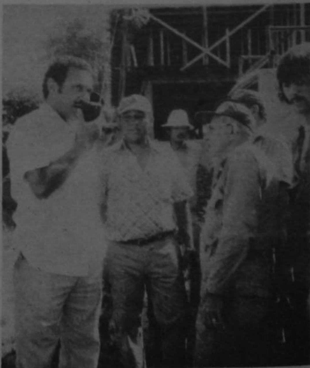
DE REGRESO A Los Chiles el Ministro Charpentier confirmó el ataque de que fue víctima, junto con sus compañeros, en el territorio nacional.