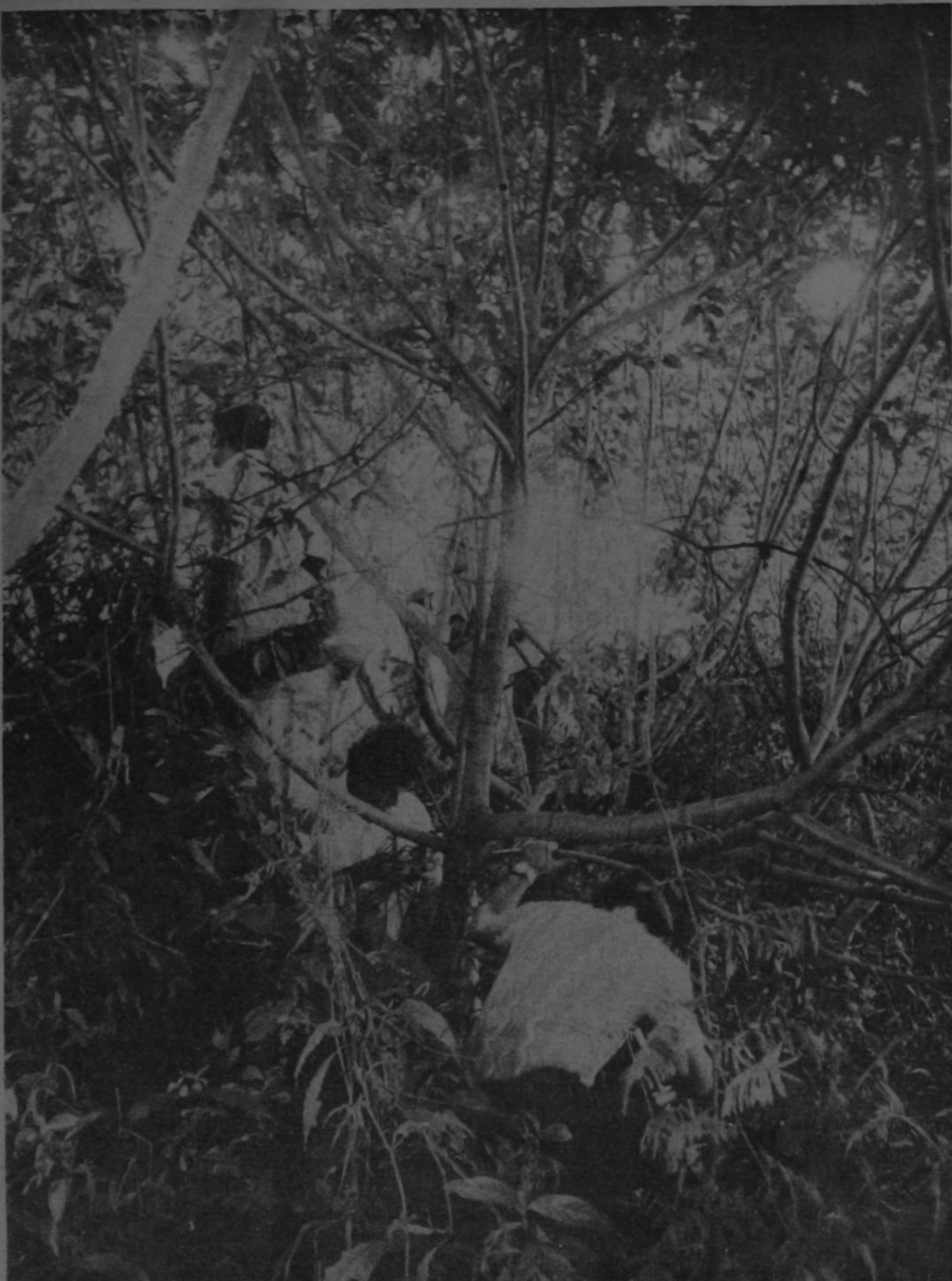
EN EL MUELLE DE LOS CHILES, el grupo de costarricenses, encabezado por el Ministro Charpentier, se embarcó para patrullar el río Frio en territorio nacional.