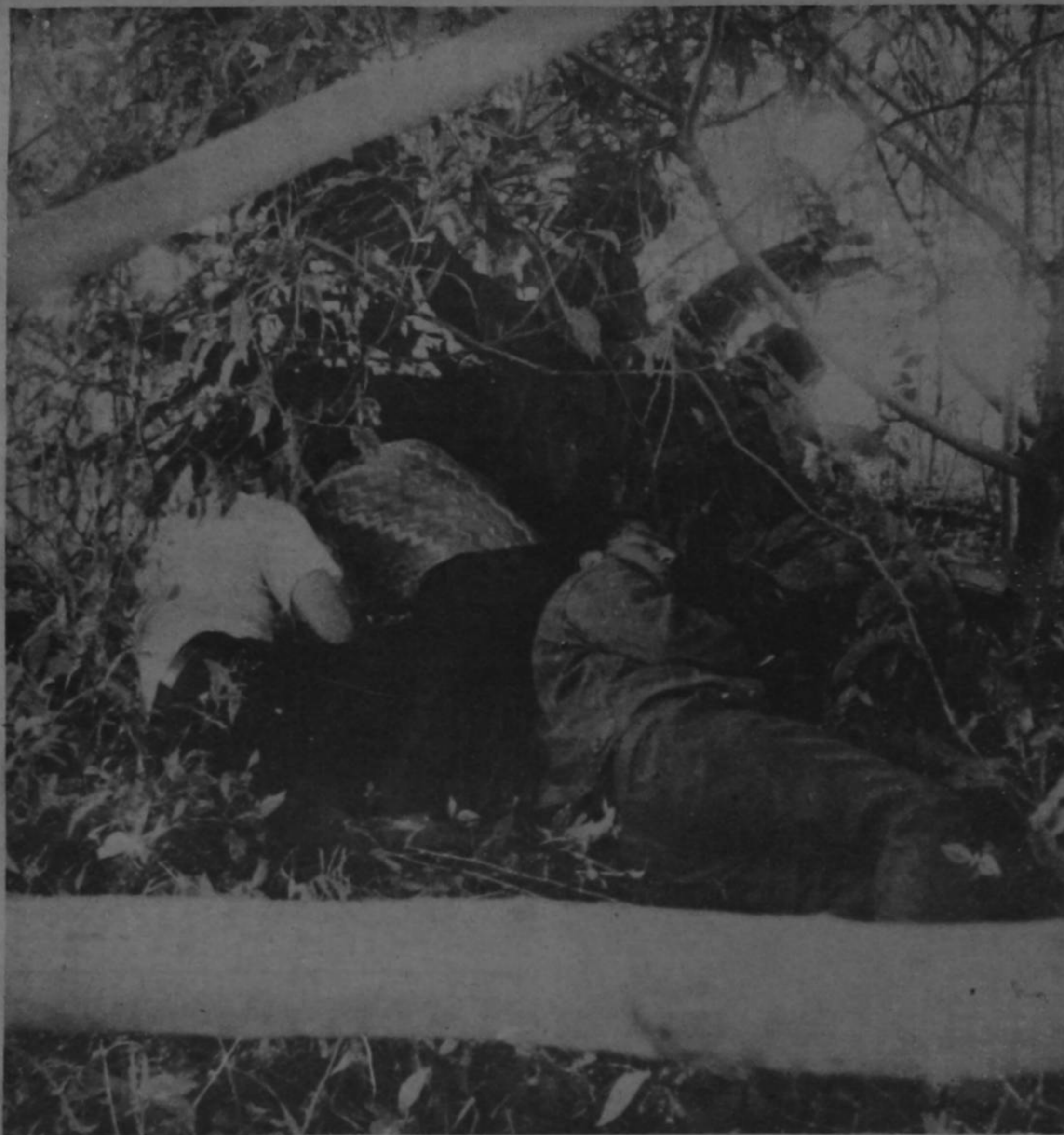
UNOS REZAN, otros vigilan las maniobras de los aviones y helicópteros que los atacaron.