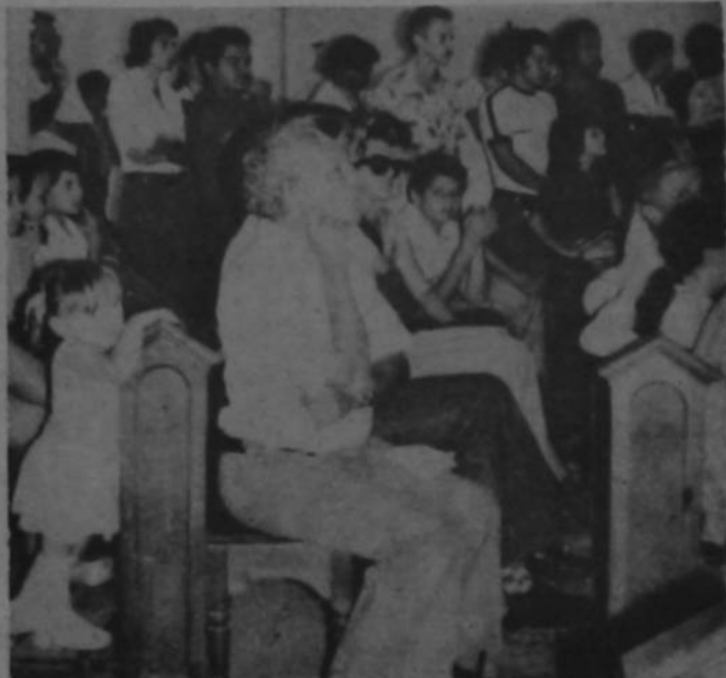
Niños, adolescentes y adultos escucharon con mucho interés el concierto de la Sinfónica Nacional que el programa Cultura en Marcha del Ministerio de Cultura, Juventud y Deportes llevó a cabo el domingo pasado a la ciudad de Atenas.