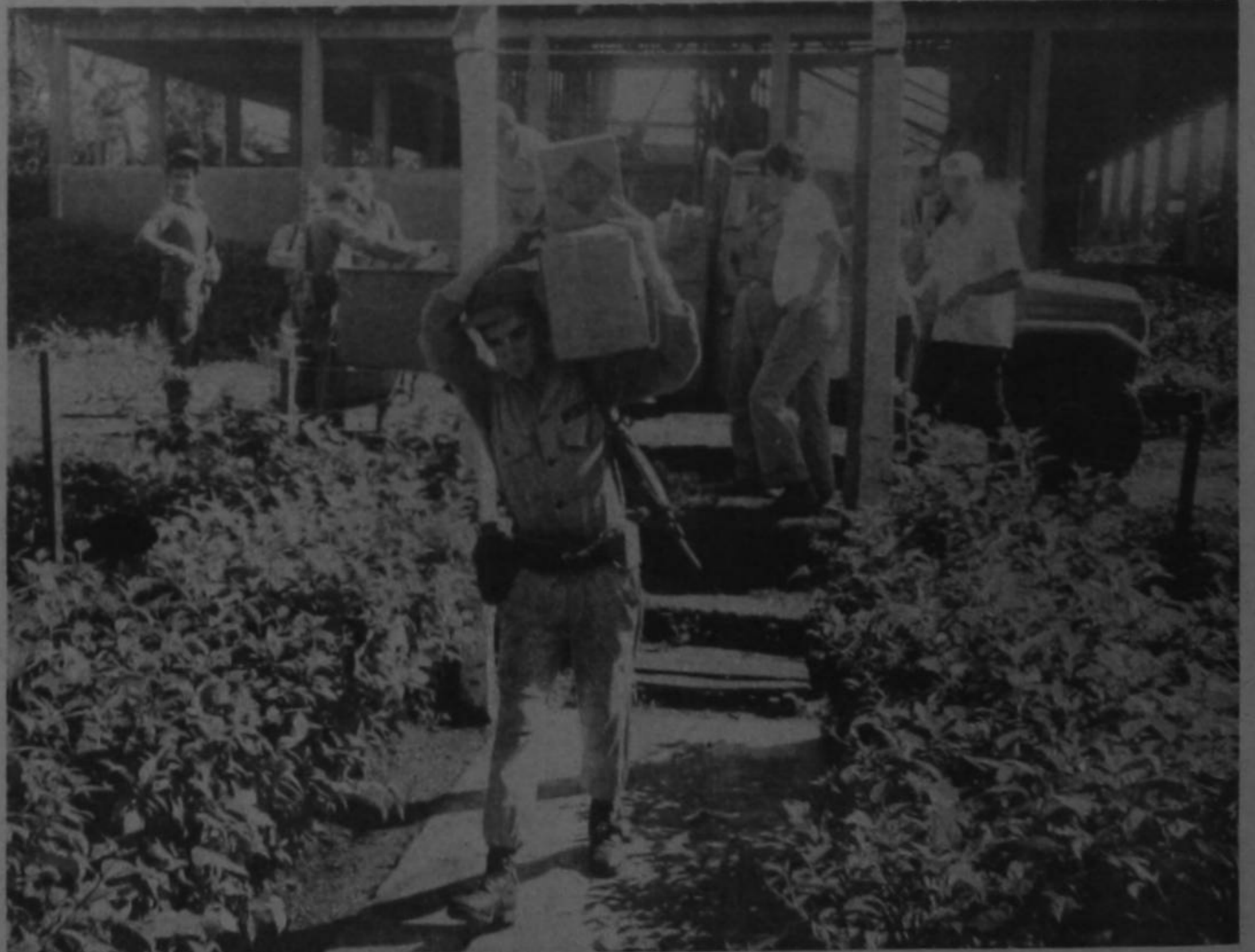
LA GUARDIA CIVIL, se acantonó en Los Chiles, en donde permanecerá indefinidamente. Fue bien provisionada ayer.