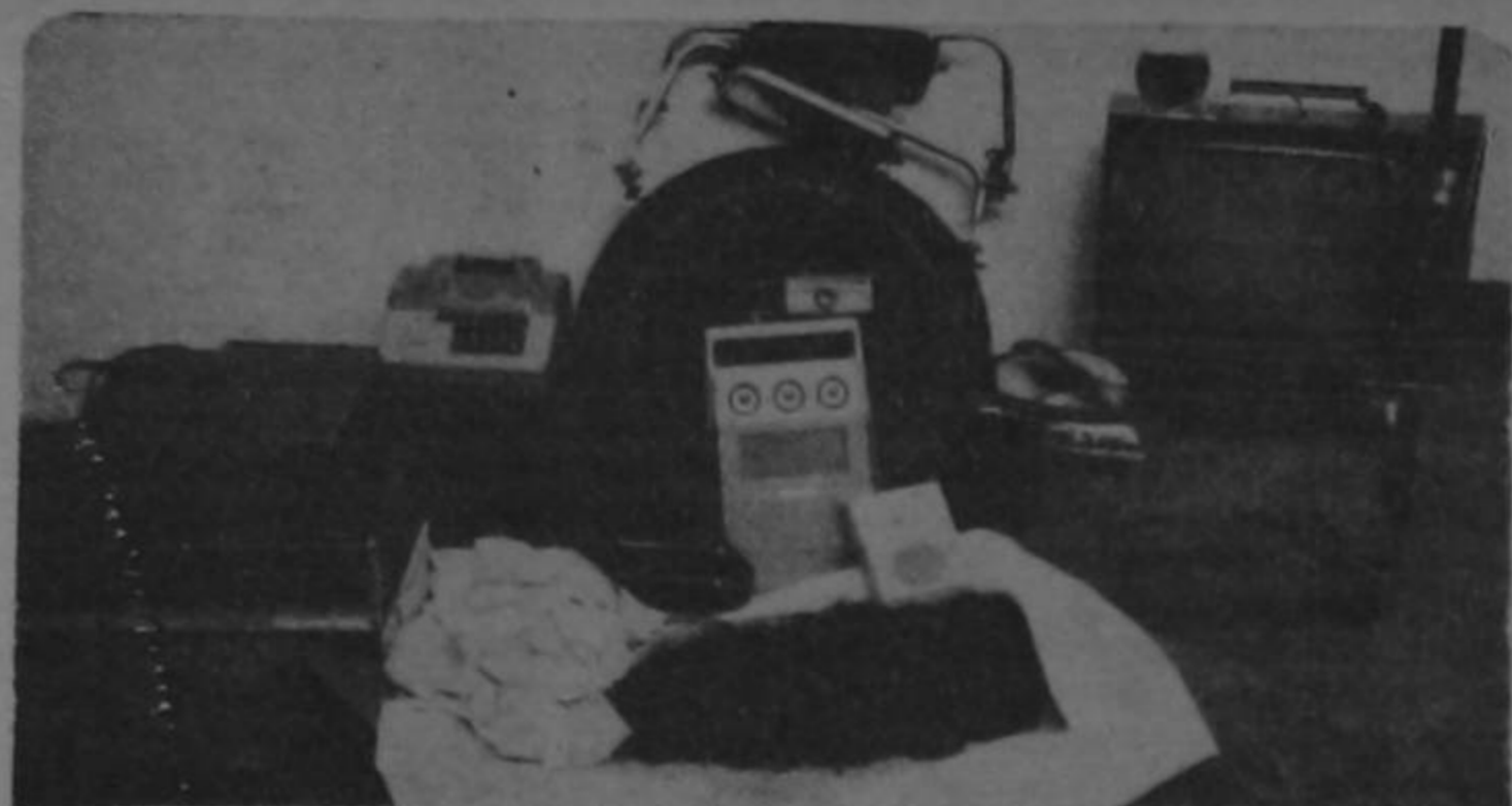
Dos libras de marihuana y los objetos de "procedencia sospechosa" que capturaron autoridades del Departamento de Narcóticos en la casa de un traficante de marihuana conocido como "Catatanga". El traficante estaba denunciado por "tráfico de drogas" y salió libre mediante una excarcelación. Actualmente anda de fuga.