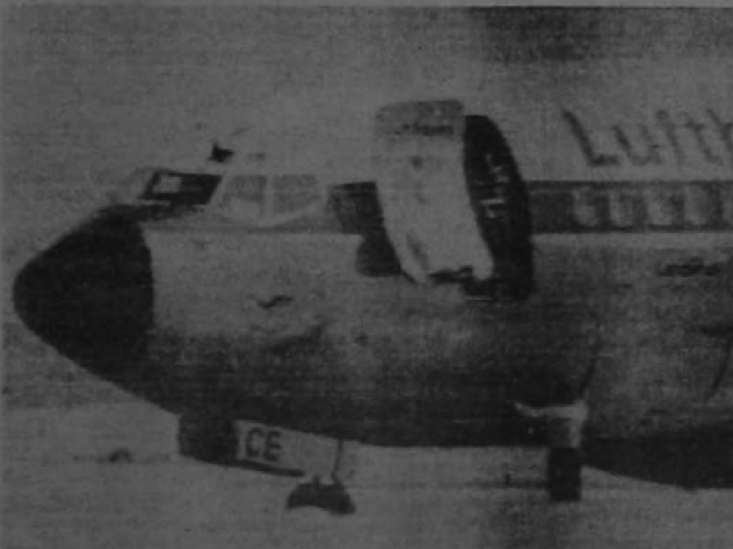
PIDEN COMIDA.- Desde la puerta delantera del avión los secuestradores piden alimento a los empleados del aeropuerto de Dubai.