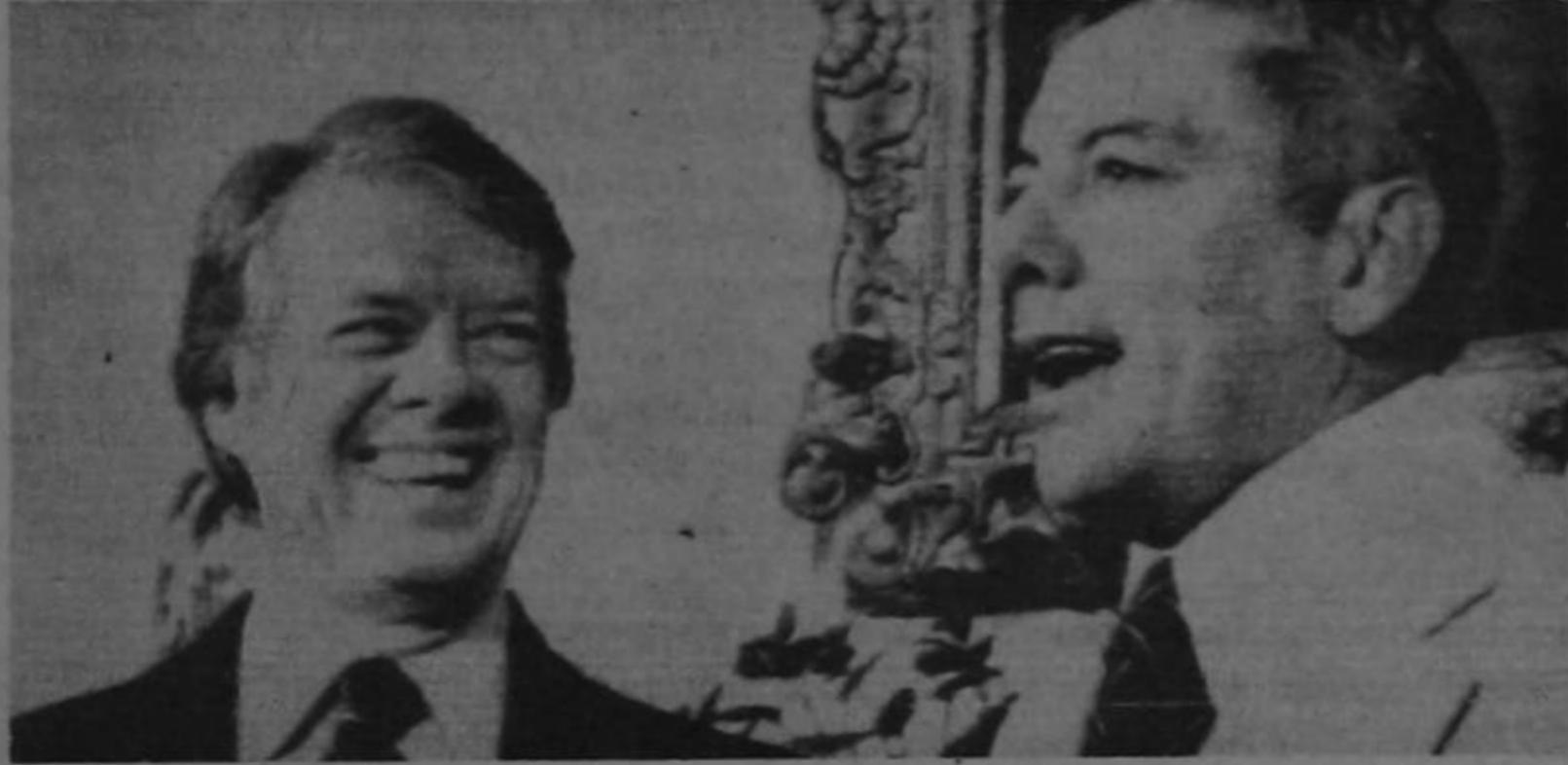
- Carter y Torrijos reunidos ayer en la Casa Blanca-

Carter y Torrijos estuvieron reunidos más de 90 minutos y un vocero dijo posteriormente que otros funcionarios de Estados Unidos y Panamá "continúan discutiendo la aclaración" para disipar cualquier malentendido surgido en los dos países acerca del propuesto tratado.